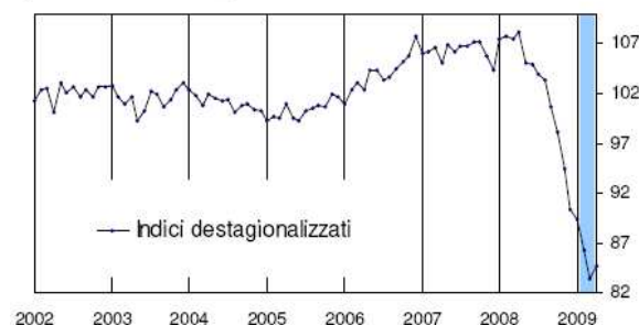
PRODUZIONE INDUSTRIALE (Indici Base 2005=100)